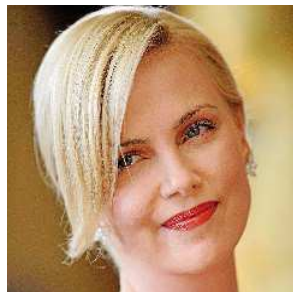
Charlize Theron Actriz

A la espera de verla en películas como Blancanieves y la leyenda del cazador o Prometheus , la intérprete norteamericana, anuncia que está a punto de firmar como protagonista de Agent 13 , trama basada en un exitoso cómic.